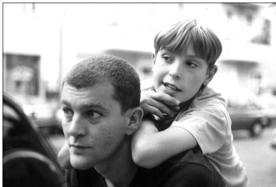
"Planung ist mühsam erlernter Aberglaube". (unbekannt)